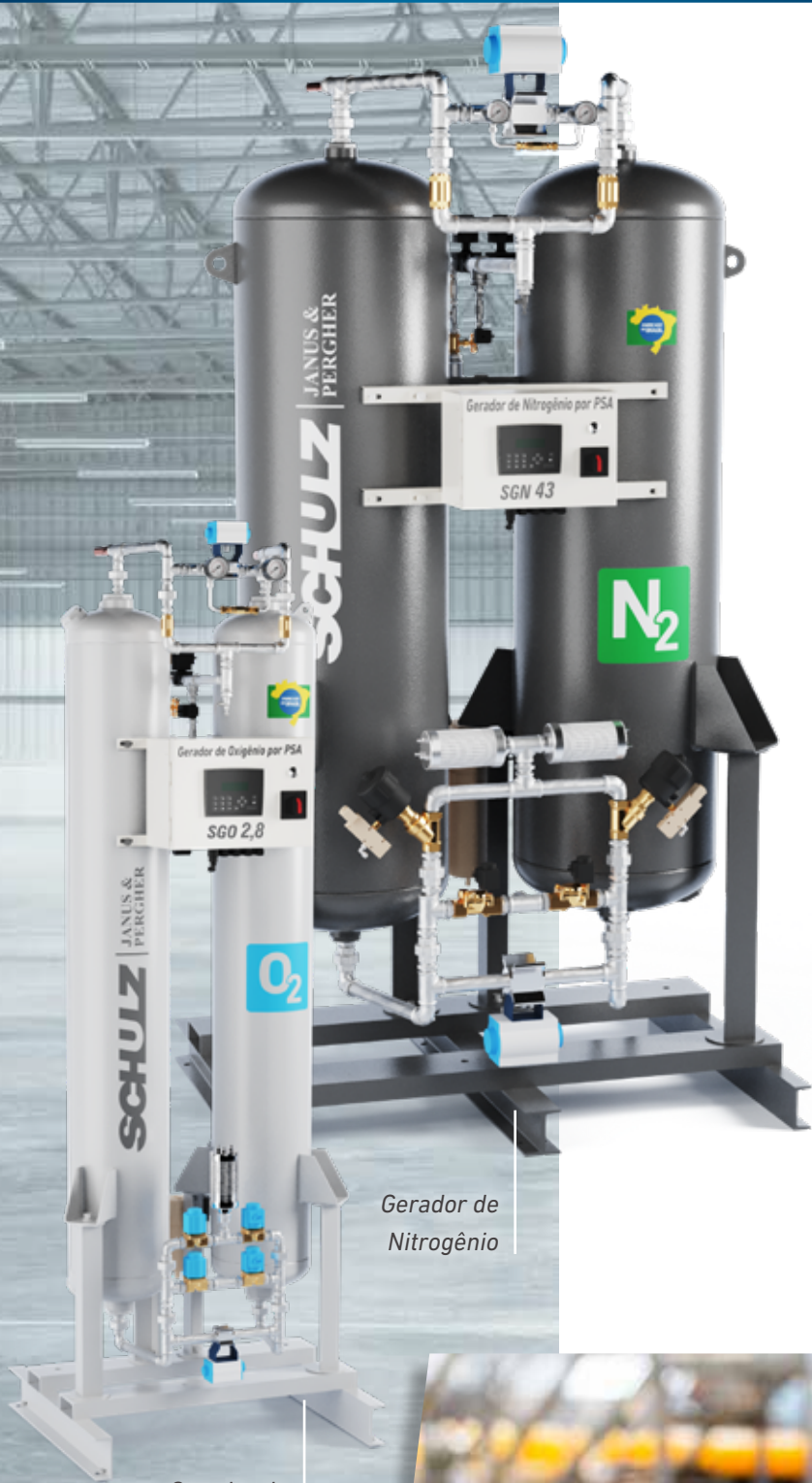
Gerador de Nitrogênio